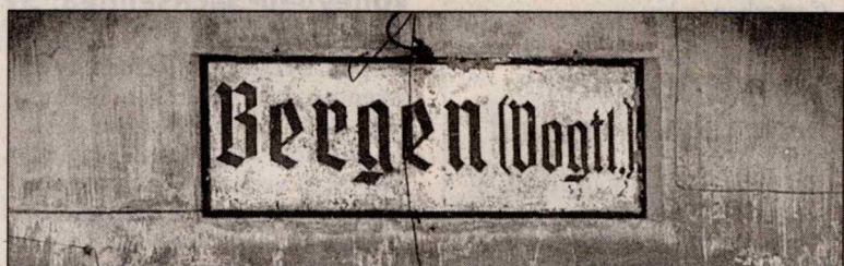
...ist am Bergener vom alten schon längst nichts mehr zu sehen.