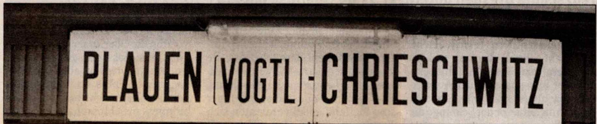
Während der Bahnhof Chrieschwitz in neuem Glanz erstrahlt...