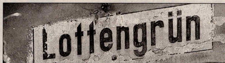
...typische Namensschild: In Lottengrün gab es früher einen Bahnhof.

Die Strecke Falkenstein-Plauen hat die Erwartungen im Personenverkehr nie erfüllt - selten waren