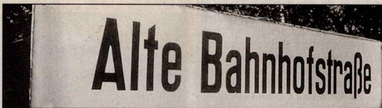
Der Straßennamen beweist das gleiche, wie das...

Die Städte Falkenstein und Plauen planten seit 1898 eine Eisenbahnverbindung. Die Verhandlungen zogen sich jedoch in die Länge, weil Falkenstein anfangs auf einer Einbindung am Oberen Bahnhof beharr-